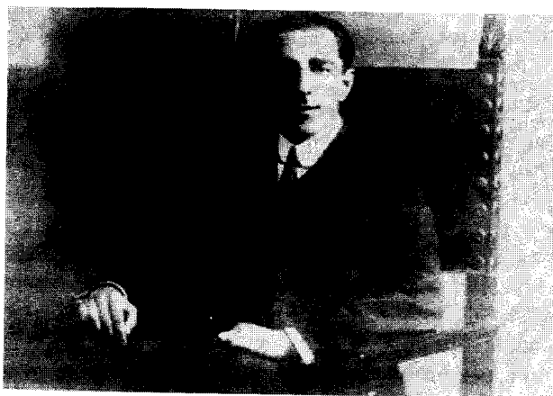
Fig. 2. Rey Pastor fotografiado en Zaragoza, hacia 1915

Dos frutos inmediatos dejó para la matemática española esta segunda estancia: la comunicación Resolución elemental del problema de Dirichlet para el círculo , presentada al congreso de la AEPPC celebrado en Valladolid en 1915 y, sobre todo, el curso avanzado Teoría de la representación conforme impartido el mismo año en Barcelona, en el Instituto de Estudios Catalanes 26 .