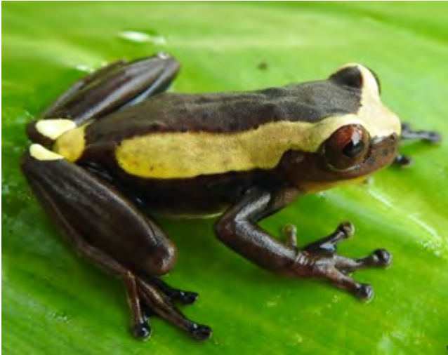
Figura 4. Vista lateral de ejemplar vivo de Dendropsophus manonegra . Departamento de Caquetá, Colombia, municipio de Florencia, vereda La Holanda. Foto: D.H. Ruiz-Valderrama, 2019