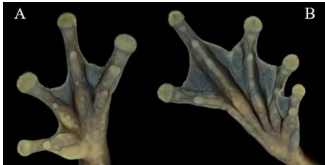
Figura 2. (A-B). Extremidad anterior izquierda con tubérculos subarticulares redondos, tubérculo palmar plano y dividido, tubérculo metacarpiano interno plano y alargado, y extremidad posterior derecha con tubérculos metatarsianos internos grandes y ovoides y tubérculos subarticulares redondos en Dendropsophus manonegra

que los dedos y las membranas interdigitales y axilares; tienen una línea bifurcada completa en las regiones cefálica y dorsolateral que se extienden hasta la ingle y manchas en el talón con una coloración amarilla (Figura 4B); el vientre, la barbilla, la garganta y las zonas ventrales de las extremidades anteriores y posteriores son de color gris;