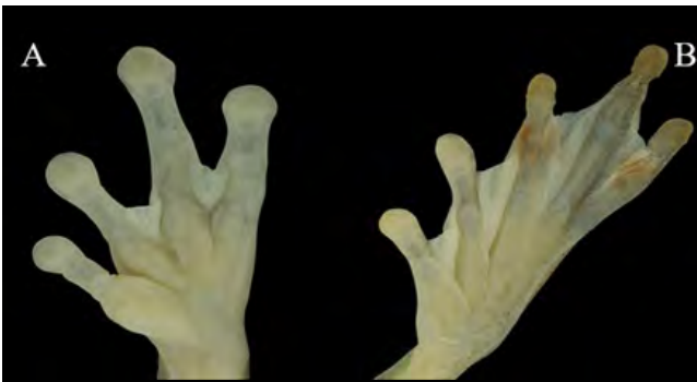
Figura 5. (A-B). Extremidad anterior izquierda con tubérculos subarticulares redondos, tubérculo metacarpiano interno plano y alargado, y extremidad posterior izquierda con tubérculos metatarsianos internos grandes y ovoideos, tubérculos subarticulares redondos en Dendropsophus sarayacuensis .