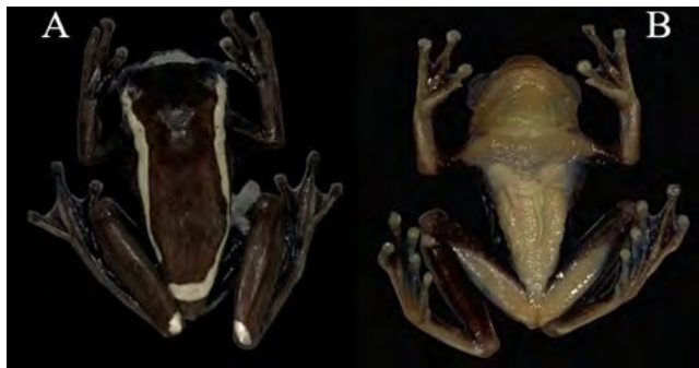
Figura 3. Vista dorsal (A) y ventral (B) de Dendropsophus manonegra . LCR 23 mm (UAM 1514 -MPO 061). Departamento de Caquetá, Colombia, Municipio de Florencia, vereda Paraíso

el saco bucal es de coloración verde; presenta dos parches glandulares ubicados en la región pectoral con una coloración blanca y separados entre sí, e iris marrón cobrizo con retículas pequeñas de color marrón oscuro (Figura 4) (Rivera-Correa & Orrico, 2013).