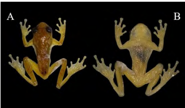
Figura 6. Vista dorsal (A) y ventral (B) de Dendropsophus sarayacuensis . LCR 18 mm (UAM 1486-DHR 015). Departamento de Caquetá, Colombia, Municipio de Belén de los Andaquíes, vereda Agua Dulce, finca las Brisas.

70 hasta 210 m s.n.m. (Cochran & Goin, 1970; Acosta, 2000; Lynch, 2005; Lynch, 2007; Lynch & Suárez, 2011; Osorno, et al. , 2011). Este nuevo registro de distribución en Caquetá demuestra que la distribución de este organismo es amplia, con variaciones altitudinales entre los 100 y los 300 m s.n.m. en esta zona del departamento, si se tiene en cuenta la distancia de los antiguos registros de distribución para la especie.