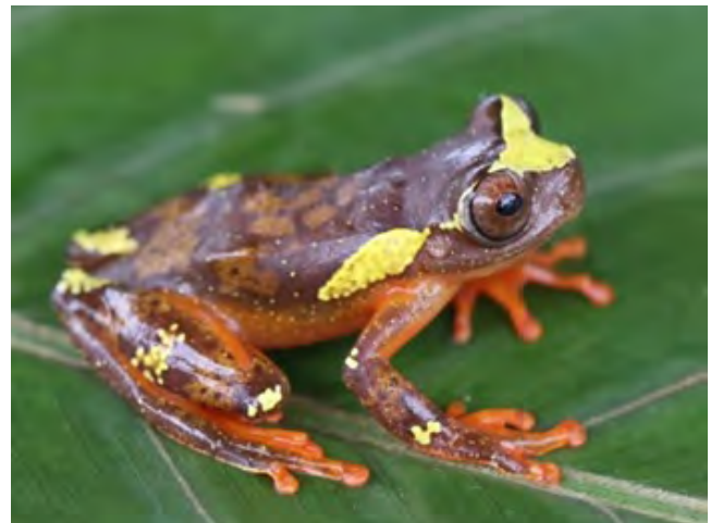
Figura 7. Vista lateral de ejemplar vivo de Dendropsophus sarayacuensis . Departamento de Caquetá, Colombia, Municipio de Belén de los Andaquíes, vereda Agua Dulce.

Dendropsophus manonegra se diferencia de otras especies del complejo D. leucophyllatus por la presencia de una coloración negra azulada en sus regiones ocultas, membranas y dígitos (Rivera-Correa & Orrico, 2013). Se considera que es la única especie con esta coloración, en tanto que D. sarayacuensis , al presentar una coloración clara, suele confundirse con otras especies como D. leucophyllatus , pero se diferencia de esta por las bandas dorsolateral delgadas que llegan hasta la mitad del cuerpo y la formación de manchas irregulares en la superficies dorsales de las extremidades (Jungfer, et al. , 2010).