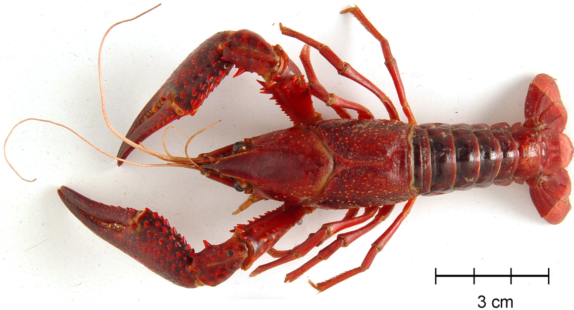
Figura 1: Procambarus (Scapulicambarus) clarkii (Girard, 1852), macho, ICN-MHN-CR 2194: vista total dorsal.

conspicuas sobre la superficie mesial, las cuales continúan hasta la porción distal (Fig. 2 C, D); el ápice del gonopodo conformado por 4 estructuras: (a) la proyección central lobulada, semicircular, con un ángulo agudo en el margen caudo-distal (Fig. 2 C E), (b) el proceso mesial prominente, triangular, con el extremo distal agudo, dirigido distalmente (Fig. C, D), (c) una protuberancia, en la porción distal de la superficie caudo-lateral del gonopodo, la cual forma una cresta elíptica distal (Fig. 2 C - E), (d) un proceso triangular, situado entre la proyección central y la cresta elíptica, con el extremo distal terminado en una espina aguda, dirigida caudalmente y ligeramente de mayor tamaño que la cresta elíptica (Fig. 2 C - E).